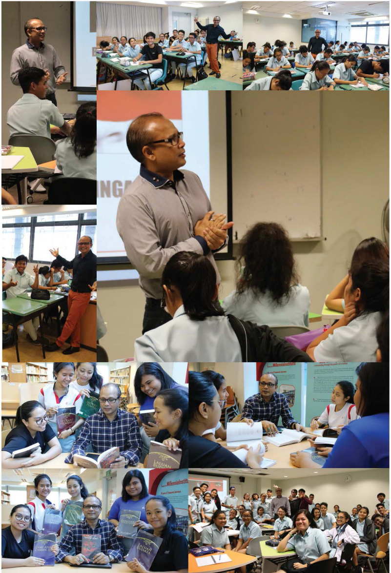
Anugerah Guru Arif Budiman 2017